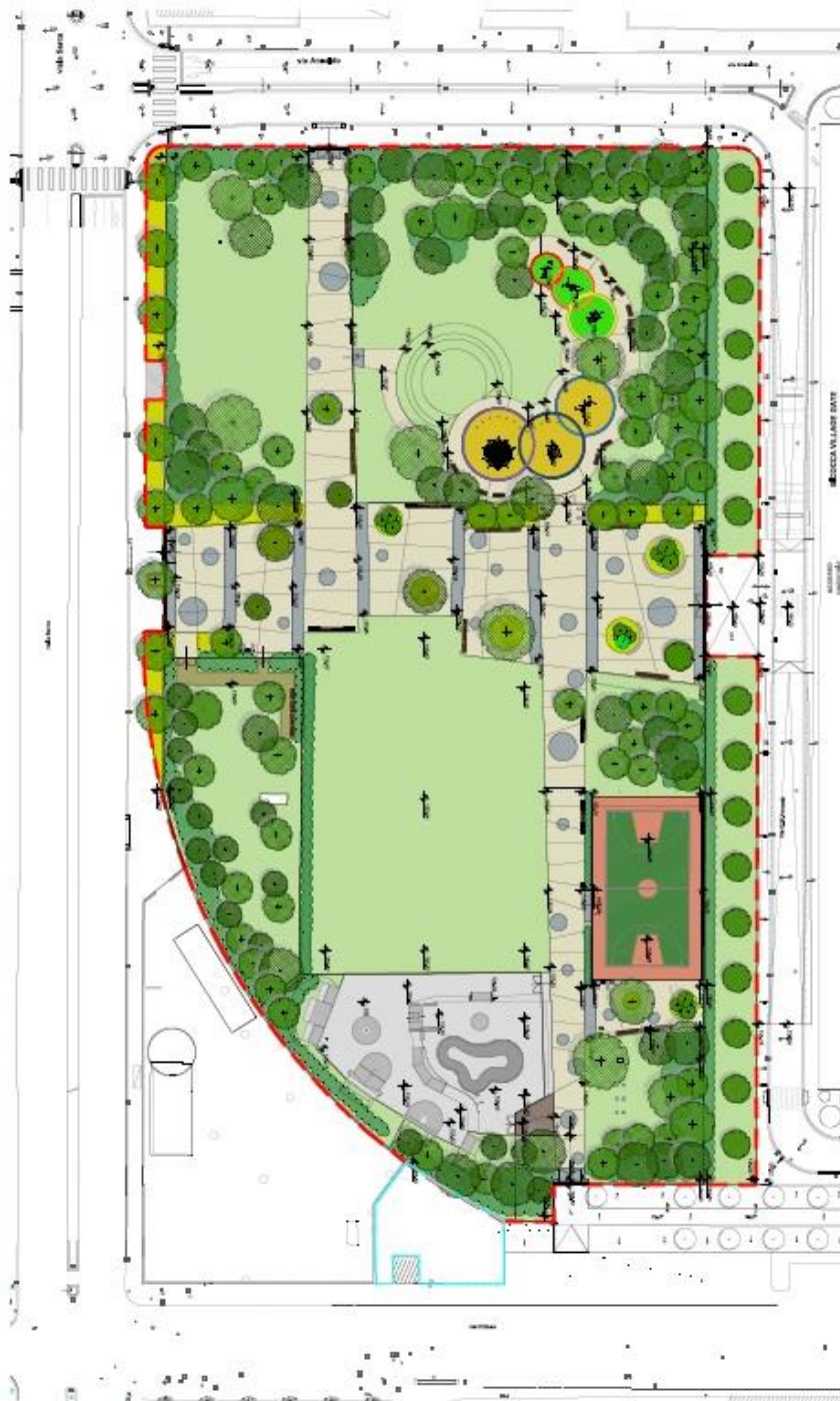
Planimetria del parco che mostra, partendo dal basso in senso orario, un parco per skaters, un campo da basket, un'area gioco per bambini, un primo spazio verde libero, un'area per cani ed un secondo spazio verde libero.

Venerdì 28 settembre viene inaugurato con la nostra partecipazione il Parco della Torre, un parco comunale multifunzionale che aiuterà a soddisfare alcuni bisogni del nostro quartiere.